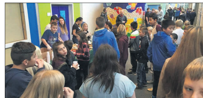
Specialklassen på Kvaglundskolen tjente 4155 kroner ind til børn vilkår på Bag for en sag-dagen.